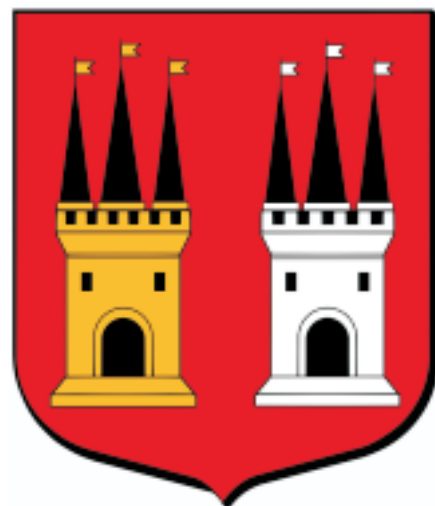
Le blason originel proposé réalisation J. P. Fernon

En 1965, Mr Hirsch a trouvé la mention des couleurs ! Fond de gueules, 1 tour or, 1 tour argent. Gueules = rouge