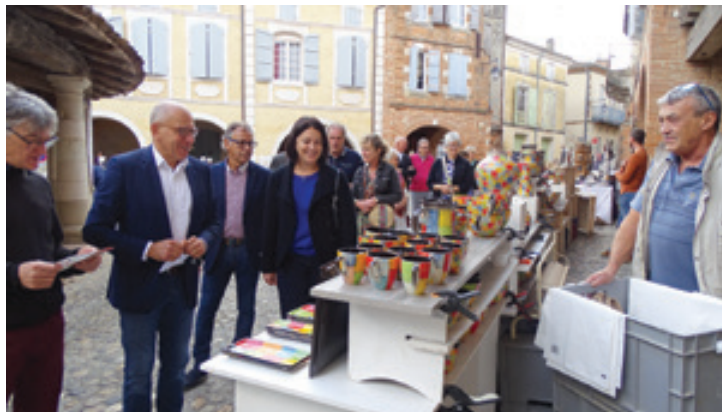
Inauguration du marché potier