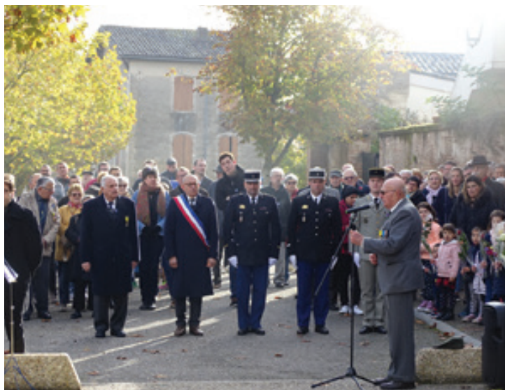
Prise de parole au 11 novembre