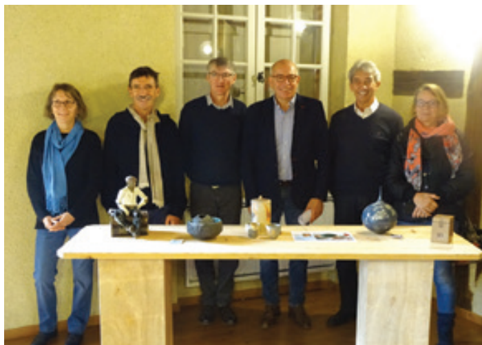
Gagnants de la tombola du marché potier