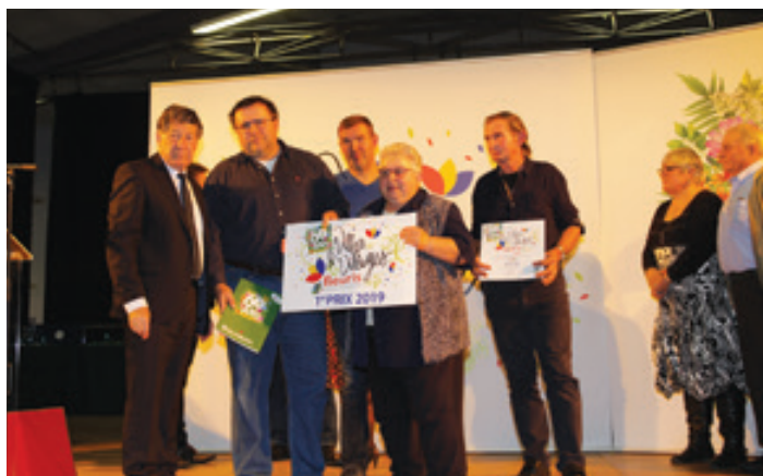
Remise des prix des villes et villages fleuris