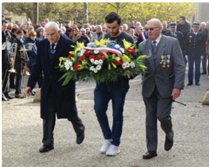
Dépôt de gerbe du 11 novembre