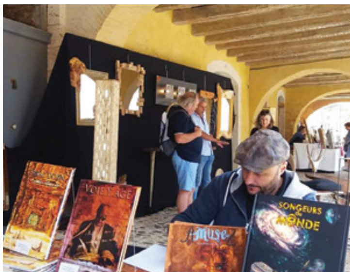
Rencontres des métiers d'art