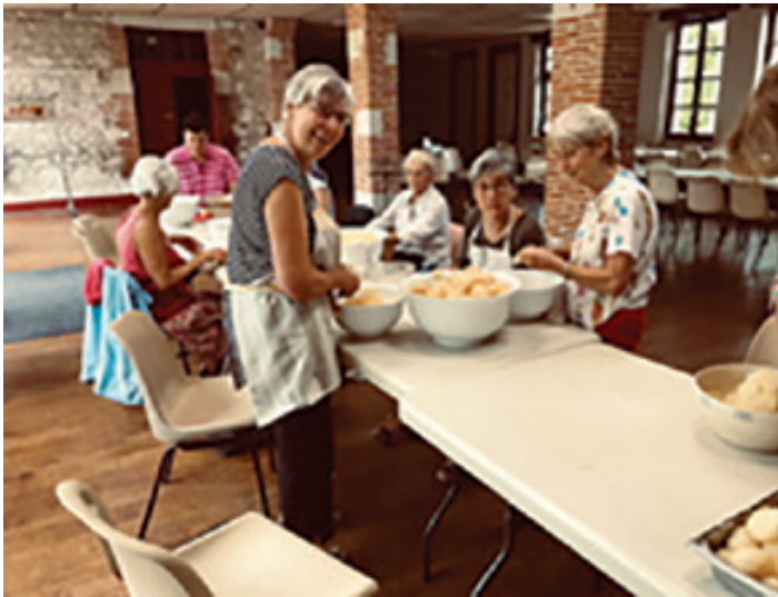
La 24 ème Semaine Musicale se clôture par une « Paëlla-Vargas » et une dernière harmonie.