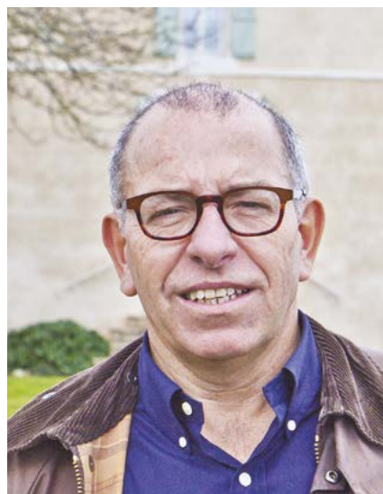
Olivier RENAUD Maire d'Auvillar

Au nom de l'ensemble du conseil municipal je vous souhaite à toutes et à tous, un excellent été 2016.